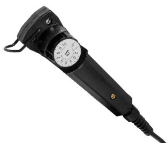
MMA 3 Telecomandă tradițională pentru reglarea amperajului